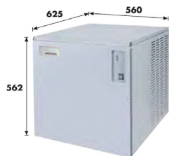
Stainless Steel AISI 304